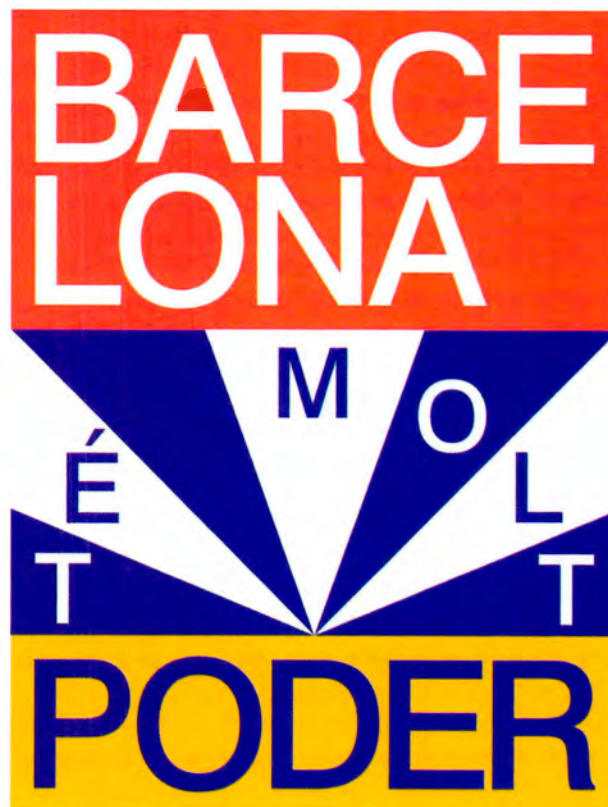
Figura 1. Cartell de la campanya Barcelona té molt poder , de Nacho Padilla, maig de 2020

Des de mitjans dels anys 1980, mentre Barcelona s'anava fent un nom com a referent internacional, la política urbana anava posant peces per reforçar