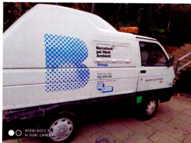
Figura 2. L'smart city i la sostenibilitat en la recollida diària d'escombraries.

Una de les manifestacions espacials de la globalització econòmica ha estat la relocalització de